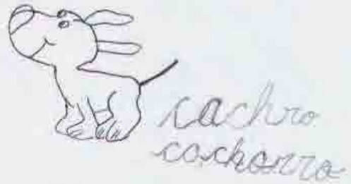
vaca cachaço cochorra