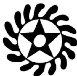
Figura 2: Sesa Wo Suban

A forma ascendente da canção transmite a sensação da transformação que gera o novo a partir do que já existe: a frase melódica da segunda estrofe é um desenvolvimento da primeira, como veremos adiante, e dela surge o coro que alerta sobre o canto do orixá. “Porque ninguém tá quando quer! Coitado do homem que cai no canto de ossanha, traidor!”