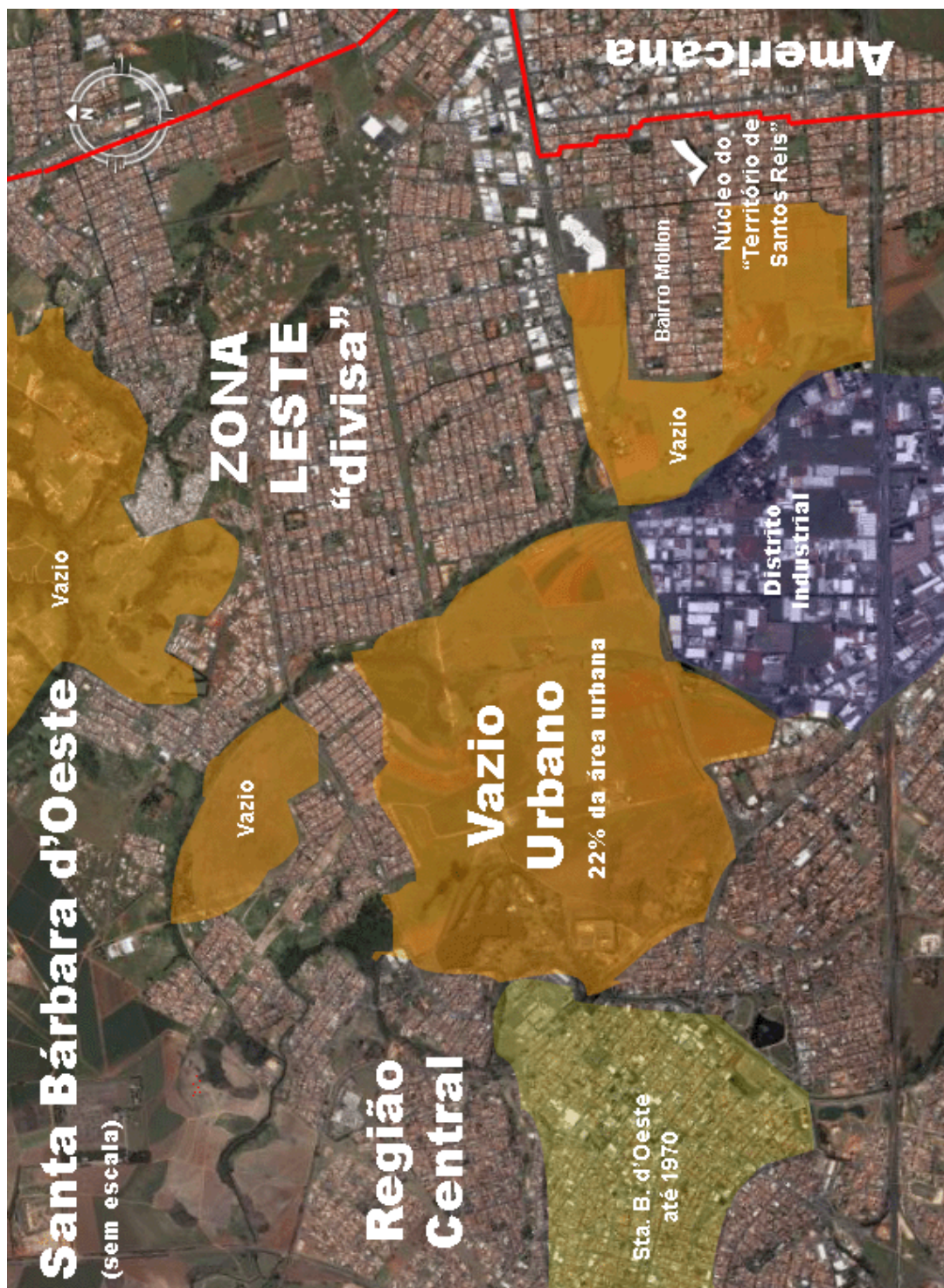
Imagem 5 – A imagem acima (satélite) representa o impacto da urbanização segregacionista em Santa Bárbara d'Oeste. É possível comparar o impacto deste crescimento urbano comparando proporcionalmente com o que “era” a cidade até a década de 70 (área amarela).