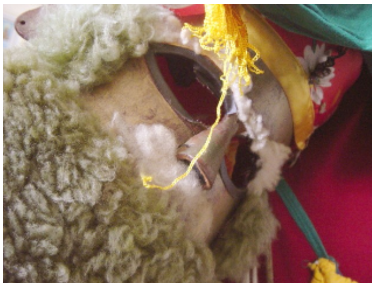
Foto 8 – Máscara do Palhaço . Segundo a tradição, o palhaço representa os soldados Romanos convertidos ao cristianismo.

As Companhias de Reis estão organizadas segundo uma ordem hierárquica que determina as funções do folião durante o culto ritual: os palhaços (Foto 8) que tomam a frente do cortejo, o embaixador (Mestre) da Companhia que “puxa” as toadas ; a porta-bandeira que representa o festeiro do ano , e por fim, os instrumentistas (cada um com um naipe específico de voz).