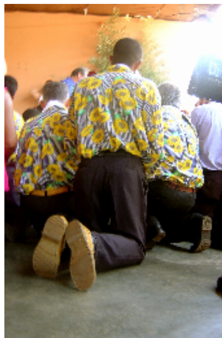
Fotos 11: Agenciamentos do processo ritual – extrema unção e sociabilidade.