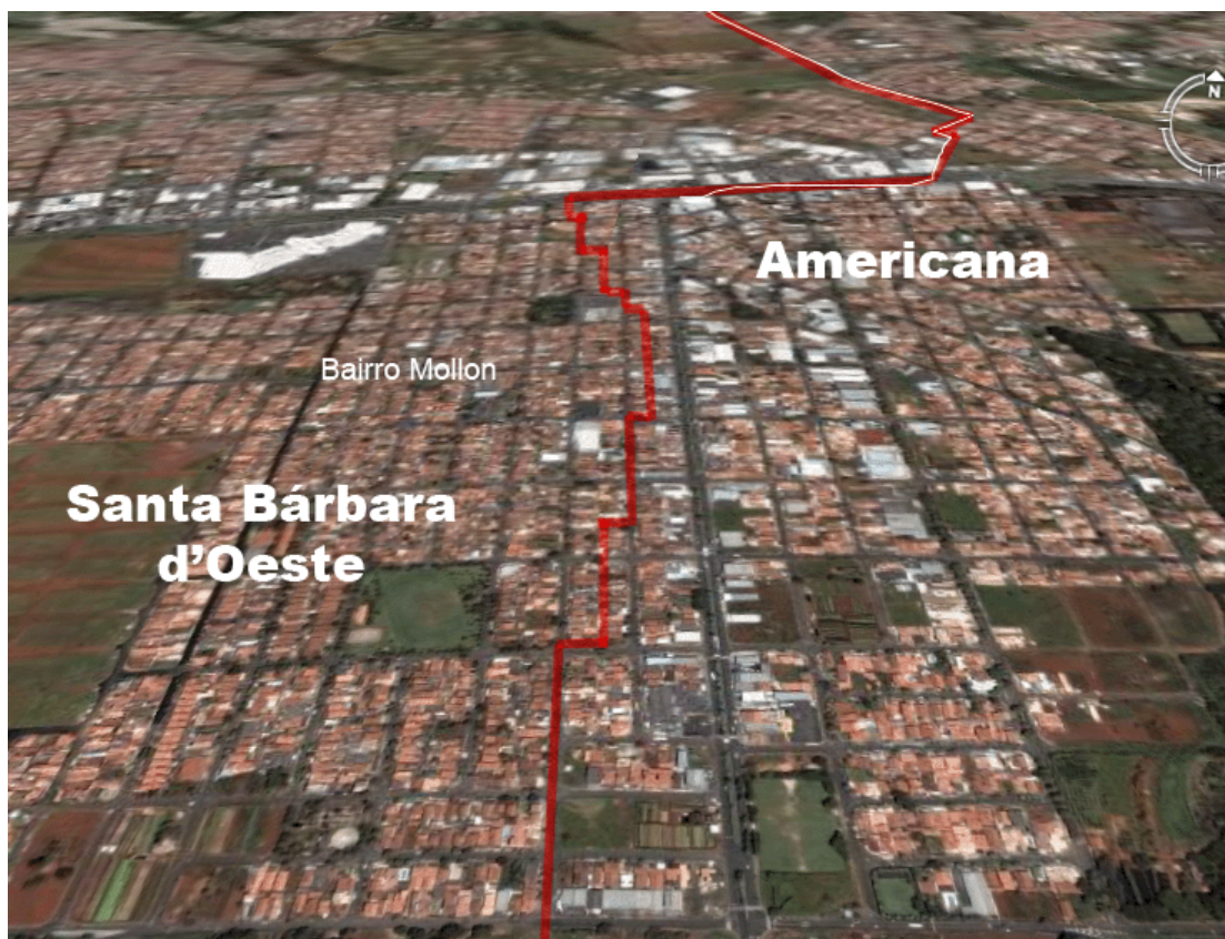
Imagem.3 - A fotografia acima representa a atual realidade da conurbação existente entre os dois municípios de Santa Bárbara d'Oeste e Americana. O bairro Mollon, localizado nesta zona de conurbação, é a localidade onde reside a maior parte dos foliões da Companhia de Reis "Estrela de Belém".

A cidade de São Paulo passou a viver as novas características daquilo que viria a ser denominada de cidade mundial . Dentre todas as características que definem uma cidade mundial , constata-se que o declínio ou desaparecimento de suas antigas funções industriais é o fator de maior destaque nesta caracterização. Por "funções industriais" subentende-se o tipo característico das relações de trabalho predominantes de tipo "fordista". Considera-se que o declínio de tais atividades, expressa o declínio de sua principal institucionalização, representada pelo emprego da mão-de-obra formal e sindicalizada. Na capital surgem novas funções, de alto teor de diversificação.