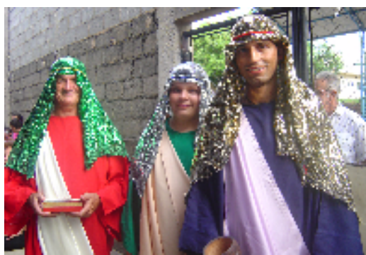
Fotos 6 - Os Três Reis Magos – Gaspar, Baltazar e Belchior – estão representados e simbolizados em todos os momentos da festa.

A bandeira (Foto 7) símbolo máximo da Companhia de Reis, é repleta de ex-votos (mechas de cabelo, chupetas de crianças, fitas coloridas com pedidos feitos aos Três Reis escritos à caneta, fotografias de pessoas doentes, de animais de estimação, bilhetes, etc.) que simbolizam a conquista de alguma graça, ou então de um pedido de proteção ao Santo. Existe dentre os foliões certas histórias de Companhias de Reis que se desfizeram após perder a bandeira . Uma Companhia de Reis,