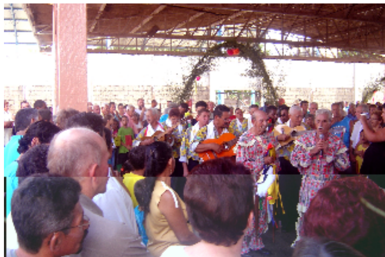
Foto 10 – Festa da Chegada . – Neste momento de celebração final, os foliões cantam toadas para cada um dos Três Reis Magos. Cada arco – como podemos observar na imagem acima – representa respectivamente cada um dos Três Reis.

os envolvidos a reprodução da memória coletiva do grupo migrante ameaçado por um desenraizamento .